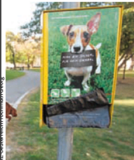
2.500 dieser Sackerl-Automaten gibt es in Wien.

Wien. 47.200 Stück Hundekotsackerln mit eindeutigem Inhalt finden täglich ihren Weg in Wiens Mist-