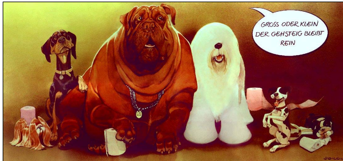
Plakatkampagne 1994 „Groß oder klein der Gehsteig bleibt rein“