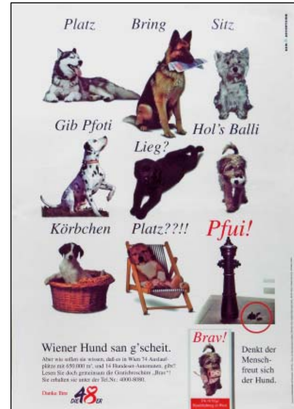
Plakatkampagne 1998 „Wiener Hund san g'scheit“